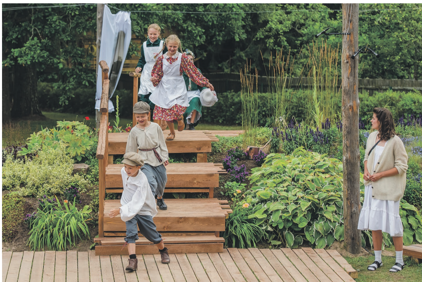
Tartu 2024 Lõuna-Eesti kogukonnaprogramm. Hetk lavastusest "Leevaku kullakaevur", suvi 2023.

Kiuma, Põlva vald, õpilane, Tartu 2024 noorteprogrammi Extended osaleja